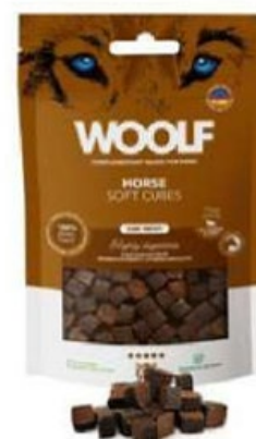
5010 Semihúmedo Caballo 100gr - EAN: 8594178551393