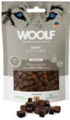
5005 Semihúmedo Cabra 100gr - EAN: 8594178551294