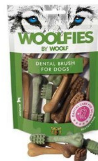
2001 Cepillo S 14pz 200gr - EAN: 8594178551010