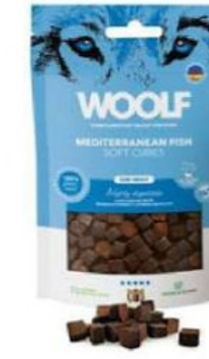
5007 Semihúmedo Pescado 100gr - EAN: 8594178551331