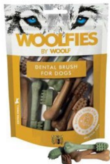
2000 Cepillo XS 200gr - EAN: 8594178551157