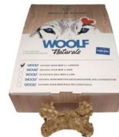
N305 Huesos Ternera y L-Carnitina 24gr 30uds/caja - EAN: 8594178550754 Ayuda movilizar grasa / Control peso perro