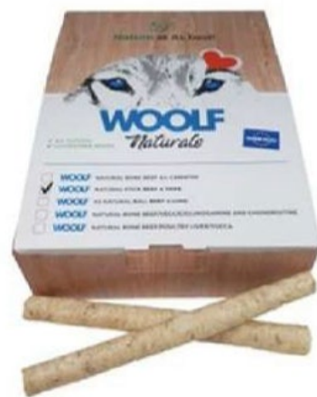
N309 Palitos Ternera y Tripa 22cm 18gr 50uds/caja - EAN: 8594178550778