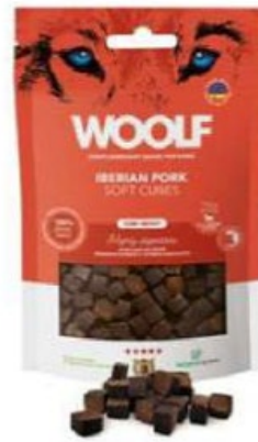
5008 Semihúmedo Cerdo Ibérico 100gr - EAN: 8594178551355