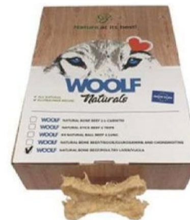
N301 Huesos Ternera/Ave/Yuca 24gr 30uds/caja - EAN: 8594178550839 Reducción olores heces