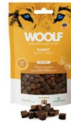
5011 Semihúmedo Conejo 100gr - EAN: 8594178551393