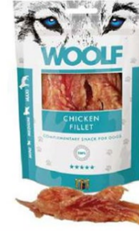
1033 Filetes de Pollo 100gr - EAN: 8594178550655