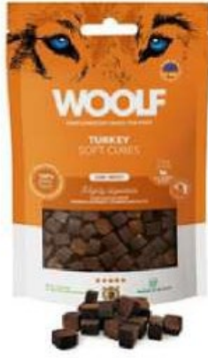
5001 Semihúmedo Pavo 100gr - EAN: 8594178551218