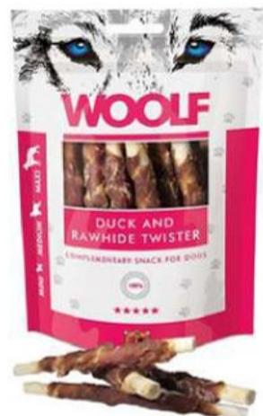
1035 Twister Pato 100gr - EAN: 8594178550693