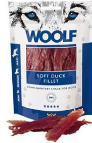
1021 Filete de Pato 100gr - EAN: 8594178550419