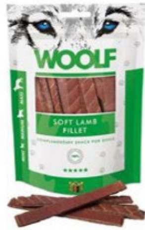
1010 Tiras Tiernas de Cordero 100gr - EAN: 8594178550198