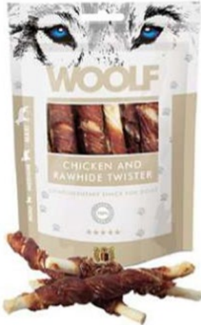
1023 Rollitos de Pollo 100gr - EAN: 8594178550457