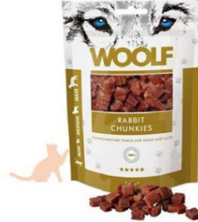
1029 Dados de Conejo 100gr - EAN: 8594178550570