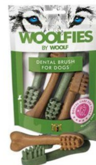
2004 Cepillo M 5pz 200gr - EAN: 8594178551072