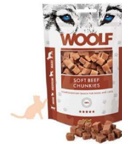
1037 Dados de Ternera 100gr - EAN: 8594178550730