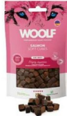
5006 Semihúmedo Salmón 100gr - EAN: 8594178551317