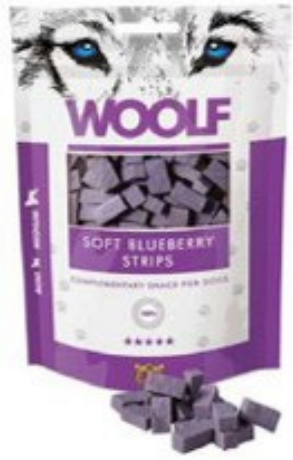
1008 Barritas Tiernas Arándanos 100gr - EAN: 8594178550150