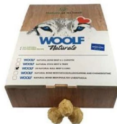
N359 Bolitas Ternera y Pulmón 900gr/caja - EAN: 8594178550792