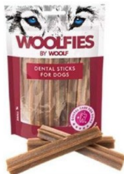
2003 Stix 10pz 200gr - EAN: 8594178551058