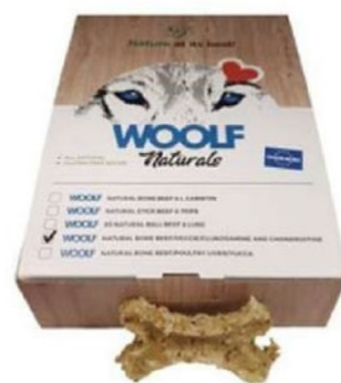
N395 Huesos Ternera, Vegetales Glucosamina y Condroitina 24gr 30uds/caja - EAN: 8594178550815 Mejora el estado de las articulaciones