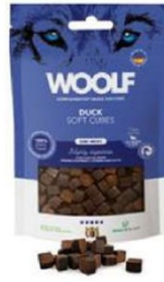
5002 Semihúmedo Pato 100gr - EAN: 8594178551232