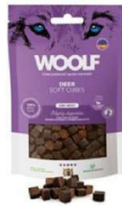
5009 Semihúmedo Ciervo 100gr - EAN: 8594178551379