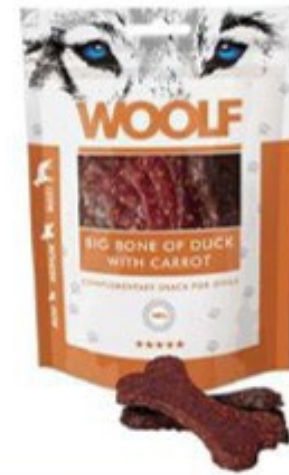
1012 Hueso Gde Pato y Zanahoria 100gr - EAN: 8594178550235