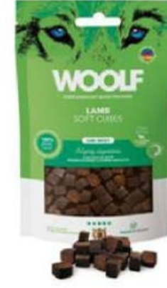
5003 Semihúmedo Cordero 100gr - EAN: 8594178551256