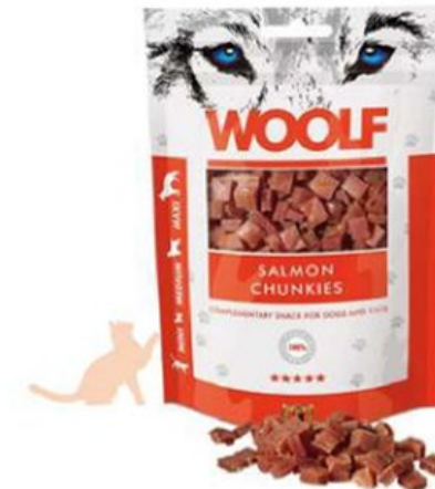
1032 Dados de Salmón 100gr - EAN: 8594178550631