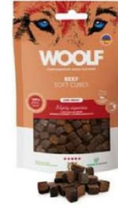
5004 Semihúmedo Ternera 100gr - EAN: 8594178551270